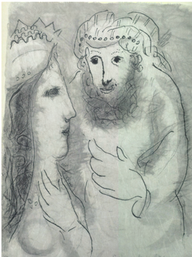
Marc Chagall: Ester raadpleegt Mordechai

- we vieren in deze dienst het Avondmaal -