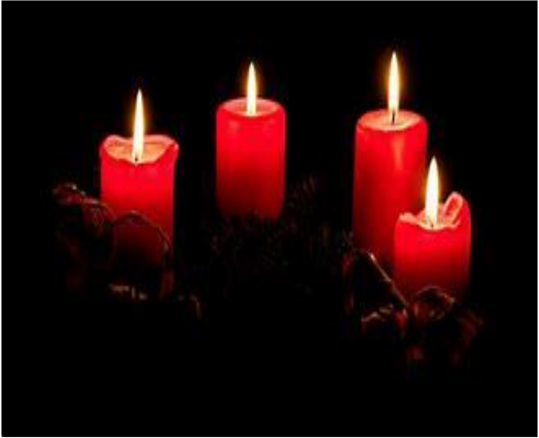
4 e zondag van advent (behoorlijk duister rond de kaarsen....)

Nieuwsbrief van de Johanneskerk (nr.43/week 51)